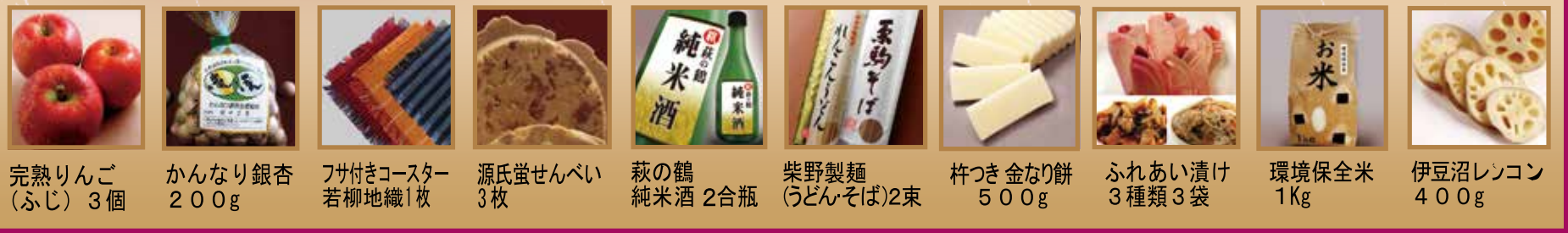
完熟りんご(ふじ) 3個 | かなり銀杏 200g | フサ付きコースター 若柳地織1枚 | 源氏蛭せんべい 3枚 | 萩の鶴純米酒 2合瓶 | 柴野製麺(うどん・そば)2束 | 杵つき金なり餅 500g | ふれあい漬け 3種類3袋 | 環境保全米 1Kg | 伊豆沼れんこん 400g